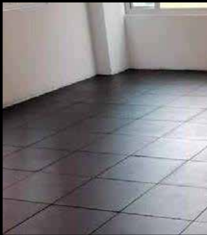
BALDOSA MODULAR LISA