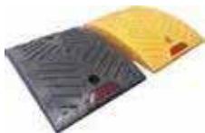
Reductor cuatro secciones