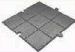
BALDOSA MODULAR A CUADROS